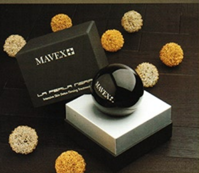
強效排毒緊緻透明霜是維持肌膚年輕奪目的美肌聖品。